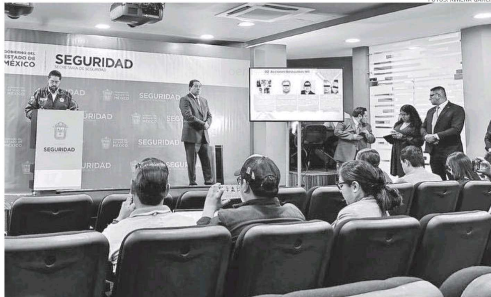
En conferencia de prensa, el secretario de Seguridad destacó que se otorgan medias provisionales de manera inmediata