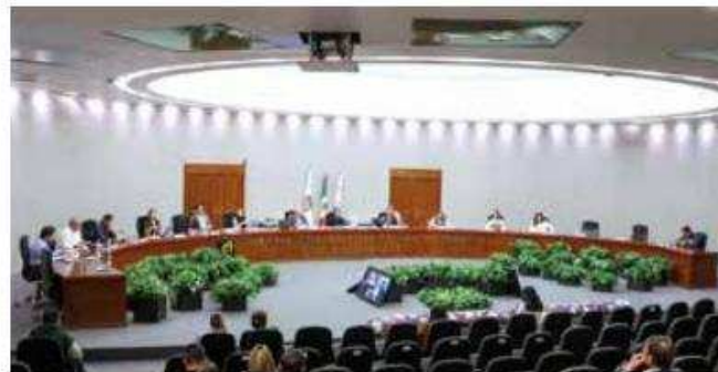
En sesión el Consejo General del IEEM.

El órgano electoral abrió todas las posibilidades para que los partidos pudieran cumplir sus obligaciones constitucionales, esa siempre fue la meta y cada decisión y actividad fueron planeadas y enfocadas a ello, es así que el Instituto protege el derecho de las y los mexiquenses de votar y ser votadas, que finalmente es el bien jurídico a tutelar.