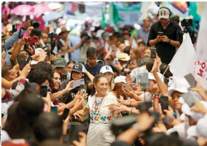
CLAUDIA SHEINBAUM, candidata presidencial por SHH, ayer en Uruapan, Michoacán.