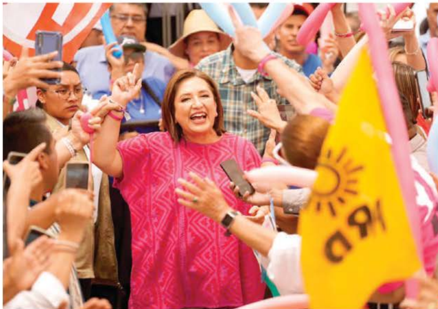
XÓCHITL GÁLVEZ, candidata presidencial por FCXM, ayer en Guaymas, Sonora.