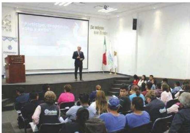
Foros Consultivos en universidades mexiquenses. ESPECIAL

Asimismo, indicó que a partir de la próxima semana se reunirán con aspirantes en Toluca, diputados locales y federales de las diferentes coaliciones políticas para presentar un documento con estos señalamientos. —